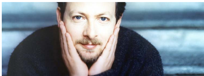
Fabio Biondi , violon et direction

Hôte régulier de nos concerts, l'Orchestre de chambre de Lausanne est, cette fois-ci, dirigé par Fabio Biondi qu'on entendra également en soliste. Fabio Biondi est spécialisé dans le répertoire des compositeurs baroques italiens et notamment dans celui de Vivaldi dont il a revisité l'œuvre et enregistré, en 1991, une version des Quatre Saisons. Il a créé en 1990 son propre orchestre qu'il dirige de son violon : l'ensemble baroque de l'Europa Galante, composé d'une douzaine de musiciens jouant sur instruments d'époque. C'est donc un programme essentiellement italien et baroque qu'il nous propose ici.