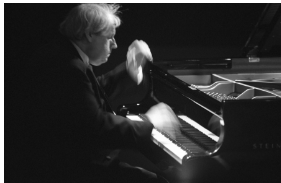
Grigory Sokolov , pianiste

Ce concert coïncide avec l'inauguration du nouveau piano de concert Steinway acquis par la Société de musique, avec le soutien de la Loterie Romande.